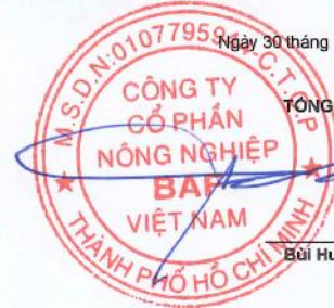
Ngô Cao Cường