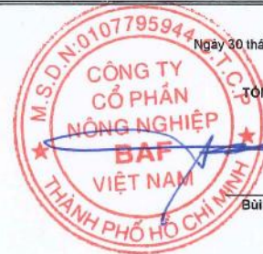
Ngô Cao Cường